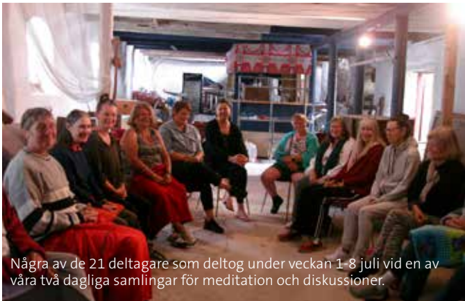
Några av de 21 deltagare som deltog under veckan 1-8 juli vid en av våra två dagliga samlingar för meditation och diskussioner.

Drygt 30 deltagare från olika delar av landet kom till Öland för att rena och hela sig själva med cellminnesmålning.